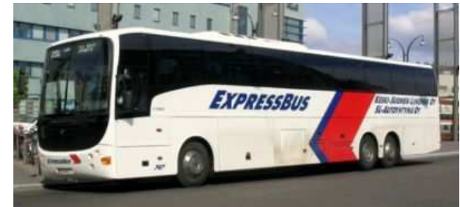
Pikavuorobussi 100 km/h