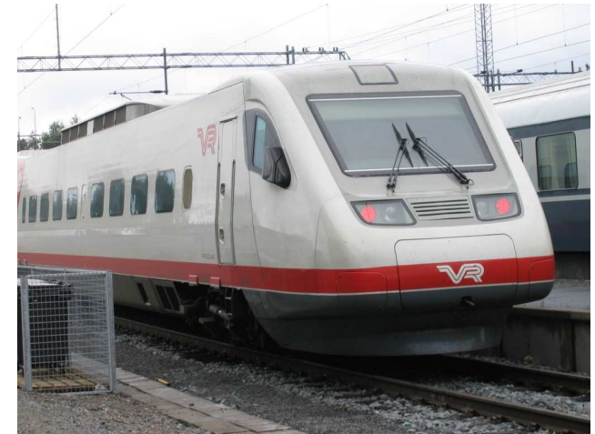
Pendolino-juna 220 km/h